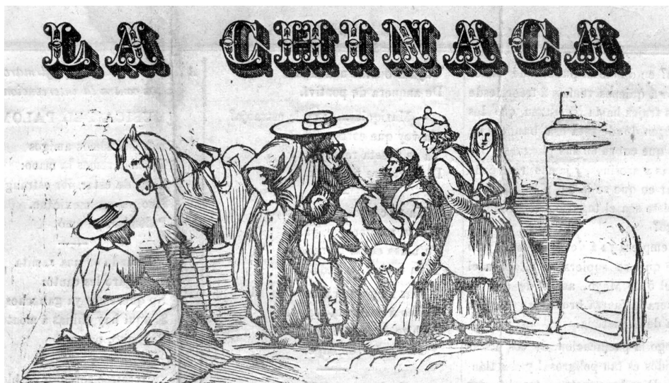
ILUSTRACIÓN 1. Mancheta de La Chinaca, Ciudad de México, 30 de junio de 1862

FUENTE: Hemeroteca, Archivo General de la Nación, México.