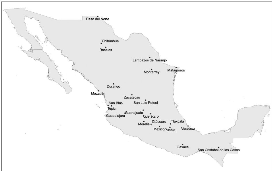
MAPA 1. México después de 1854

mexicanos, latinoamericanos y otros residentes de las Américas, las balas no solo derribaron a un hombre, sino a la idea misma de que la civilización y la modernidad emanaban de Europa; no solo mataron a un pirata, mejor dicho, sino que enterraron para siempre la posibilidad de un retorno de la monarquía y de un abandono del republicanismo en las Américas. El coronel y escritor liberal mexicano Juan de Dios Arias sostuvo que la ejecución de Maximiliano era “una lección saludable á la Europa”, ya que el triunfo de la “democracia” serviría como un faro de esperanza para los “seres oprimidos del mundo” 3 . Los patriotas mexicanos no solo habían salvado a su país, también habían favorecido la extensión del republicanismo democrático a lo largo y ancho del globo. El árbol de libertad había sido regado con la sangre de los tiranos.