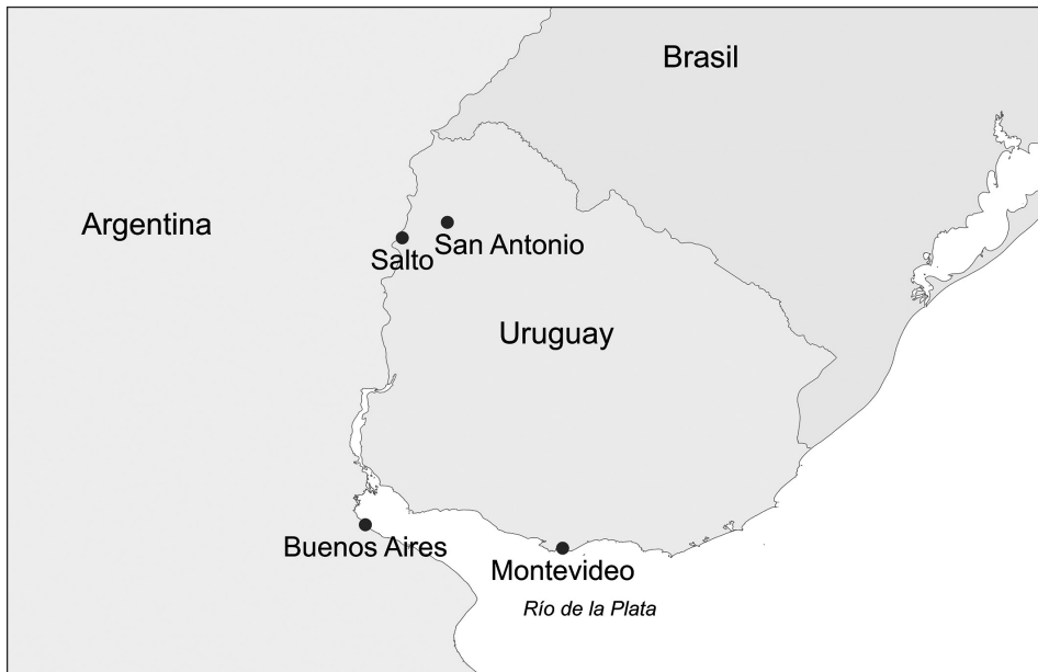
MAPA I.1. Uruguay ( Banda Oriental )