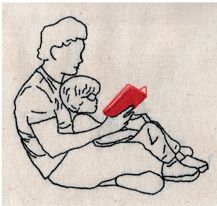
ILUSTRACIÓN I. Padre leyendo junto a su hijo

Dada la amplitud de las características de los mediadores, esta guía también reconoce las distintas formas de una familia: algunas tan pequeñas, como las monoparentales, y tan grandes, como las multigeneracionales; hay familias tan diversas, como las familias homoparentales. La clave es que en el corazón de cada familia el gusto y amor por la lectura puedan florecer.