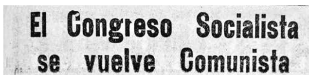
Figura 1.3. Titular de El Tiempo , 7 de mayo de 1924

(actual Alcaldía Mayor), y el Congreso Obrero. La agitación era grande. Ambos congresos se extendieron por varios días y dieron lugar a apasionadas discusiones: en los intercambios de esas conferencias circulaba el nombre de Marx, se explicaban las perversiones del capitalismo, se conmemoraba a los trabajadores asesinados por sus capataces, se listaron las necesidades y demandas de los obreros colombianos y se eligió a la flor del trabajo . Al cabo de algunos días, de forma inesperada, los asistentes al Congreso Socialista adhirieron a la tercera internacional (es decir, a los preceptos comunistas).