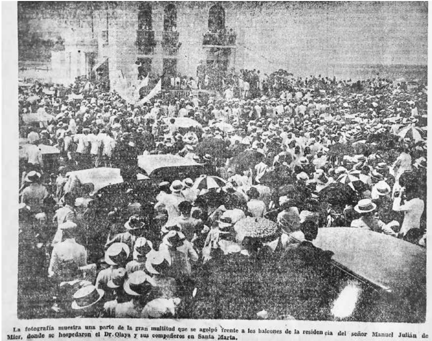
Figura 2.4. Recibimiento a Olaya Herrera en Santa Marta