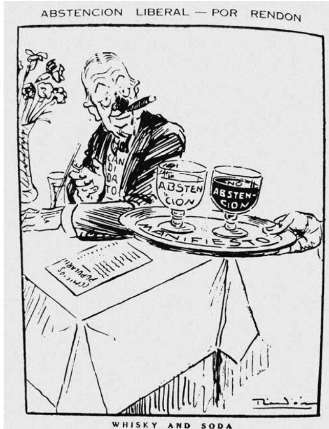
Figura 2.1. Caricatura de Rendón del 18 de noviembre de 1929 para significar la indecisión de los liberales frente a la escogencia de un candidato propio

Rendón atacaba todos los días con duras caricaturas. Desde su puesto en el Directorio Liberal, Turbay empujó para que se realizara una nueva convención liberal y se abandonara la abstención.