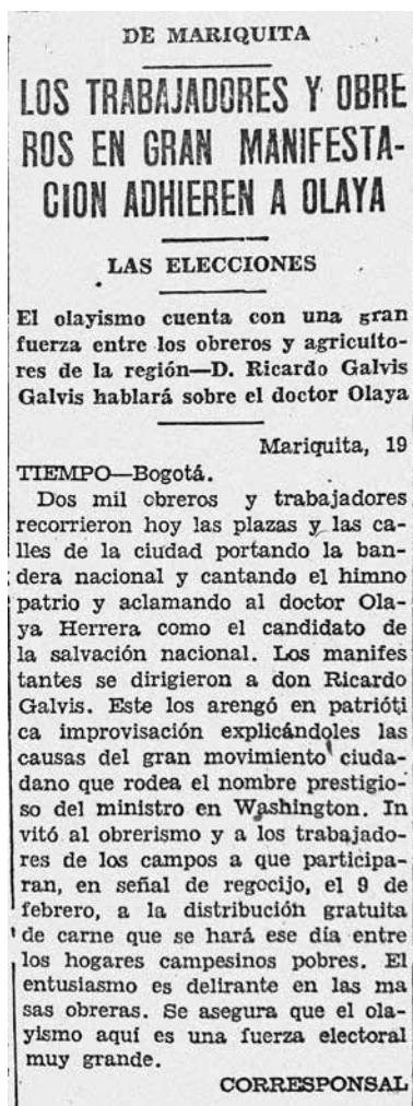
Figura 2.3. Noticia en El Tiempo , 20 de enero de 1930

A menudo, el candidato objeto del agasajo cedía la palabra a Turbay tan pronto se bajaba del tren: «Profundamente agradezco la fervorosa manifestación. Para que os enteréis de los propósitos que nos animan y de cuál es la política de la Concentración Nacional, os va a hablar el doctor Gabriel Turbay» 24 . Olaya, exhausto por el viaje, le pedía también consulta al joven médico, y según Luis Eduardo Nieto Caballero, este le formulaba globulitos de zinc.