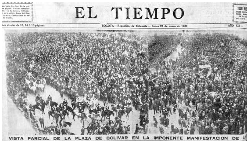
Figura 2.6. Recibimiento a Enrique Olaya Herrera en Bogotá

Desde Fontibón, sin solución de continuidad, había un cordón de gente hasta la Plaza de Bolívar, con protuberancias enormes como la Avenida Colón, donde, desde lo alto, se veía un oleaje, como un mar. La Plaza de Bolívar era uno de los espectáculos más grandiosos, conturbadores y exaltadores que yo haya visto en mi vida 26 .