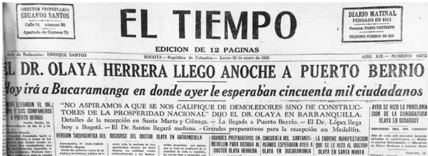
Figura 2.5. Registro de la gira de Olaya Herrera en la prensa