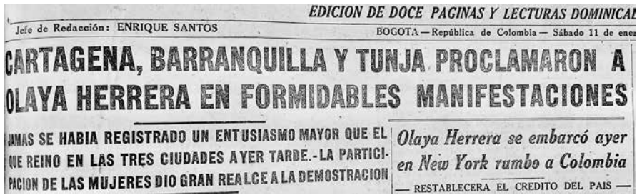
Figura 2.2. Primera plana de El Tiempo , 11 de enero de 1930

Después de otros cruces telegráficos (en uno de ellos, Olaya Herrera renunciaba a ser candidato si su nombre era presentado por el Partido Liberal solamente) y tras varios editoriales, consultas y acuerdos, finalmente, el 6 de enero la prensa anunciaba que este hombre sí se aprestaba a librar esa batalla. Se anunciaba su viaje de regreso a Colombia para mediados de enero. Quedaba muy poco tiempo, pues las elecciones eran el 9 de febrero. De nuevo, la intervención de Gabriel Turbay fue decisiva: