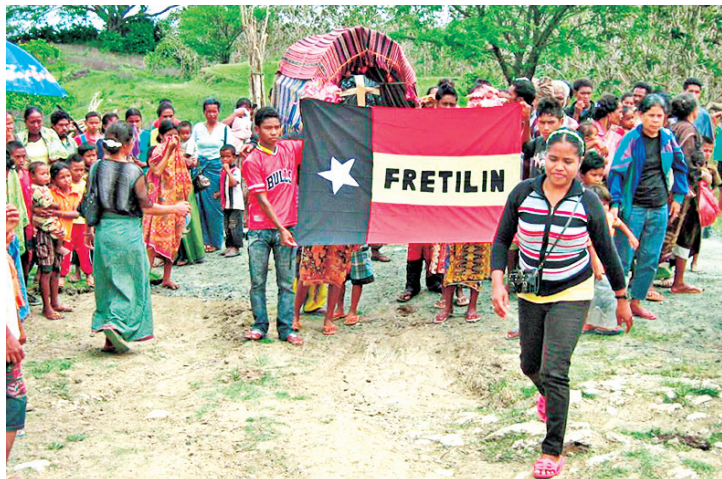
Foto 3. La bandera de FRETILIN aún es reconocida por los timorenses; en este caso, es presentada cuando el equipo forense de SCIT retornó a los familiares los restos identificados de una de las víctimas de 1999.

Como respuesta a la iniciativa de la ONU, y con el fin de acallar las aspiraciones independentistas de los timorenses, las fuerzas armadas indonesias propiciaron la formación de milicias integracionistas que, según el Equipo Argentino de Antropología Forense (EAAF), durante los meses previos a las votaciones, cometieron abusos e intimidación contra la población civil (EAAF, 1999; García, 1999).