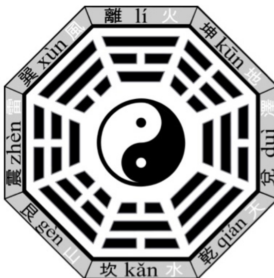
Figura 2. El Pa Kua de la filosofía China. Se puede traducir al español como “ocho estados de cambio”. Representa las leyes que rigen el mundo y da las pautas para entenderlo.