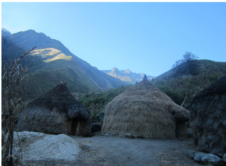
Ilustración 1. Makotama