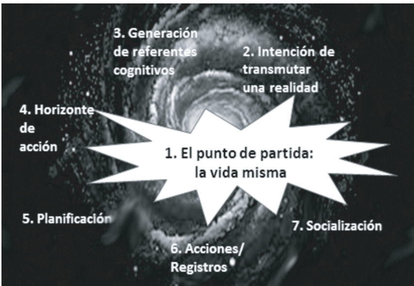
Momentos del Proceso de metodización.