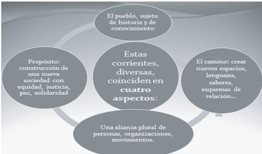
Gráfico N° 3. Horizontes de las corrientes del conocimiento en América Latina. Elaborado por Julio Valdez. 2021.

Es claro que las propuestas nuestroamericanas de indagación y creación cognitiva trascienden el mero ejercicio de crear y aplicar métodos de investigación. Apuntan a un horizonte de transformación radical de la sociedad, e incluso de nuestros modos de relacionarnos, de pensar y de actuar en la vida cotidiana. Incluso, algunos pensamos que señalan los fundamentos de una nueva civilización. Podemos esquematizar algunos aspectos relevantes en el siguiente gráfico: