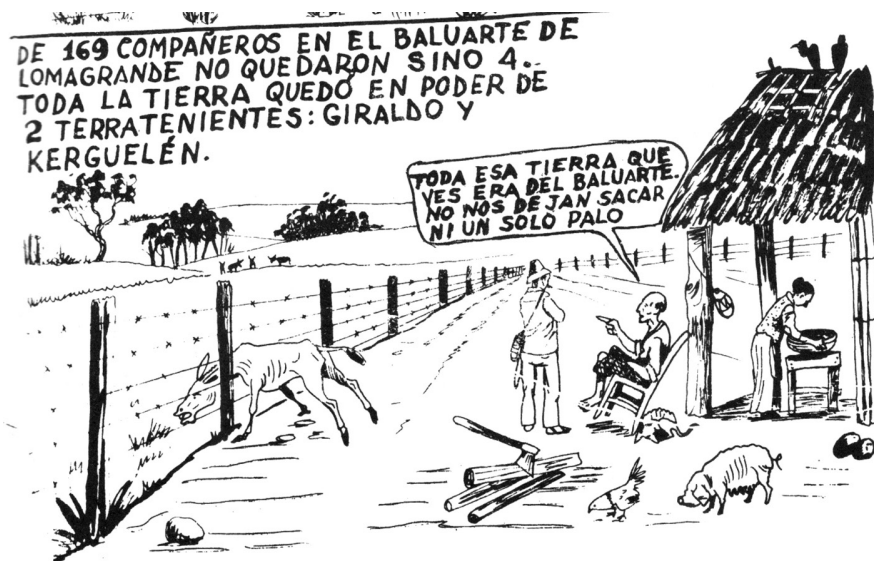
Ilustración 1.2. El Baluarte después de que se favoreciera a los latifundistas.

En este cómic publicado por la Fundación del Sinú vemos a campesinos pauperizados, cuyos animales languidecen de hambre bajo el acecho de dos buitres ubicados en el techo de la choza.