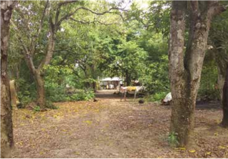
Figura 1. Casa de Librada Mendoza. Fuente: fotografía de Guillermo Valencia, junio de 2019.

Hace falta mirar para arriba para ver el patio de la casa de Librada Mendoza. La puerta de la casa de Librada es también la puerta de entrada al arroyo. La casa de Librada no es la casa que se ve al fondo, en el centro de la fotografía, ese es uno de los cuartos de la casa. La casa es ese cuarto y también es el patio que lo rodea, las personas que van caminando, los árboles de mango, limoncillo, guásimo y matimbá que rodean el camino hacia el arroyo Ají Molido y el caballo que está ensillando uno de sus nietos, que se dirige a sacar arena para venderla al siguiente día en Malagana.