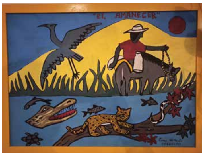
Figura 14. El amanecer . Fuente: pintura de César Villa, 2019.

Esta diferenciación, sin embargo, reproduce formas de entender y hacer la naturaleza y la cultura como opuestos inconmensurables. No obstante, estas relaciones más-que-humanas (o entre jaguares-vacas, humanos-vacas, jaguares-humanos) son localizadas y situadas; se hacen de manera específica e histórica en cada lugar. Las agencias involucradas siempre se disputan y no son inmóviles. Entonces, los jaguares no es que sean «lo salvaje», «lo natural», y punto. Como dice Haraway (2016 [2003], p. 30), no siempre co-habitar significa erizarse o acariciar, pues «las especies de compañía no son siempre compañeros listos para discutir [...], la relación siempre es multiforme, en juego, inacabada y con múltiples significados».