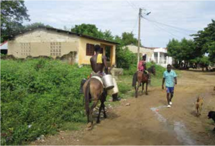
Figura 12. Palenqueros transportando leche.

Según Friedemann, en su libro Ma Ngombre: guerreros y ganaderos en Palenque (1979, p. 114):