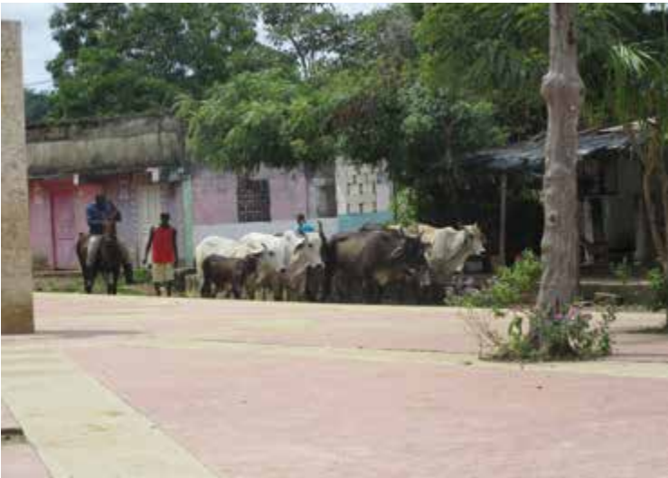
Figura 10. Plaza central de Palenque. Fuente: fotografía de Sebastián Espinosa, octubre de 2018.

SEBASTIÁN ESPINOSA, Palenque (Bolívar), octubre de 2018