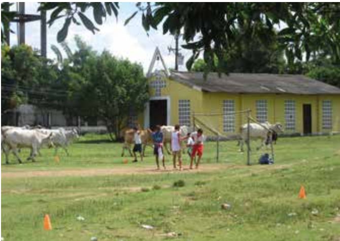
Figura 13. Parque central de Gamero.

SEBASTIÁN ESPINOSA, Gamero (Bolívar), julio-agosto de 2019