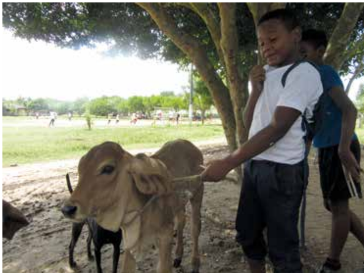
Figura 17. Los niños de Gamero y el ternero de Cira. Fuente: fotografía de Sebastián Espinosa, octubre de 2018.

Las vacas, diariamente, están habitando el parque con los niños o con Cira. Algunos humanos asumen que otros cuerpos no pertenecen o no pueden habitar este espacio con nosotros, que no participan en la elaboración de este. Y pese a que en la planeación de espacios urbanos (como plazas y parques) el diseño se construye para y por humanos, permanece la tensión y potencia de que estos espacios han sido y hoy hacen parte del hábitat de no-humanos.