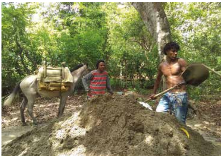
Figura 4. Sacando arena del arroyo.

La arena que se saca del arroyo se la venden a las volquetas que vienen a comprar desde Turbaco y, sobre todo, desde Arjona. La arena se usa para la construcción de casas, para la fabricación de bloques de construcción, para hacer carreteras, entre otras actividades. La cantidad de arena la miden por «pote» (tarro); un metro de arena equivale a 200 potes o tarros. Para sacar la arena del arroyo hasta la carretera se abren caminos por los patios de las casas, «tramposos» les dicen a estos pasajes. Desde hace más de cuarenta años, en cada casa de Palenquito se abrió una abertura en el patio, «la famosa entrada», me cuenta «El Negro», un vecino joven de Librada que en los últimos tiempos trabaja sacando arena (figura 4). De ahí, del patio, se hacían caminos de unos dos metros de ancho en bajada hasta el arroyo.