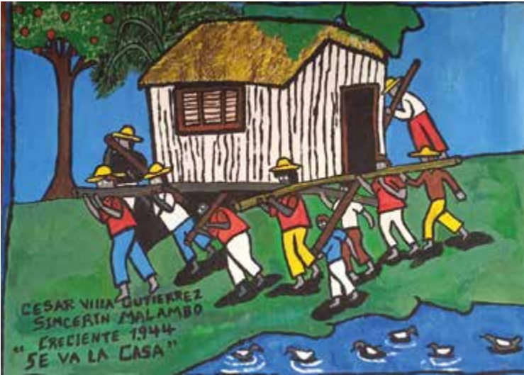
Figura 5. Se va la casa. Fuente: pintura de César Villa, 2016.

La relación cultural con el arroyo se puede entender como una apertura a la comprensión ontológica del territorio y del pueblo. La casa, el patio, sus árboles no solo están articulados desde el trabajo y el cuidado, sino desde la comprensión que se tiene del agua. Para Librada su casa no ha sido únicamente posible por su cuidado del jardín o por la sombra de los árboles de mango, sino por su relación con el agua, con el arroyo.