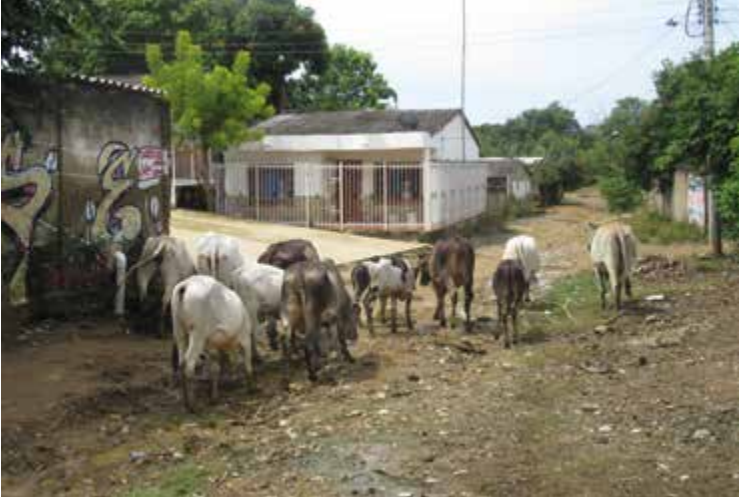
Figura 11. Calle bajo la plaza central de Palenque.

La plaza es y ha sido uno de los sitios emblemáticos palenqueros; la plaza representa uno de los lugares más importantes en la vida de cada palenquero y palenquera. La plaza es un centro de vida, históricamente vivimos los palenqueros con nuestros animales.