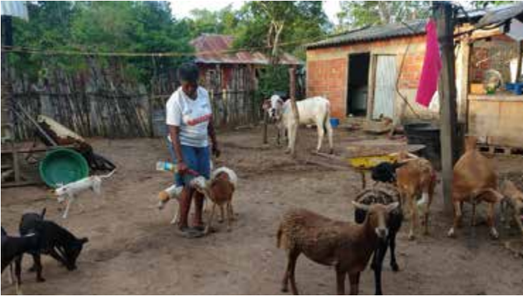
Figura 7. Patio de animales pequeños de Cira.