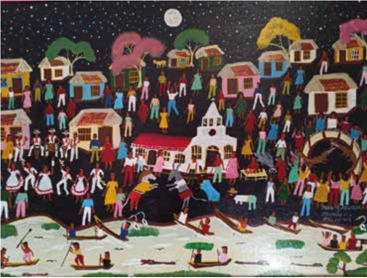
Figura 9. Un pueblito del Caribe colombiano. Fuente: pintura de Marcial Alegría y Mauricio Alegría, 2018.

Es necesario contar los lugares de manera diferente. En el cuadro Un pueblito del Caribe colombiano , animales y humanos se entrelazan, comparten y hacen el espacio que habitan. Esta pintura primitivista de los Alegría contiene uno de los espacios comunes y permanentes del Caribe colombiano: la vida compartida y entrelazada del encuentro entre humanos y no-humanos.