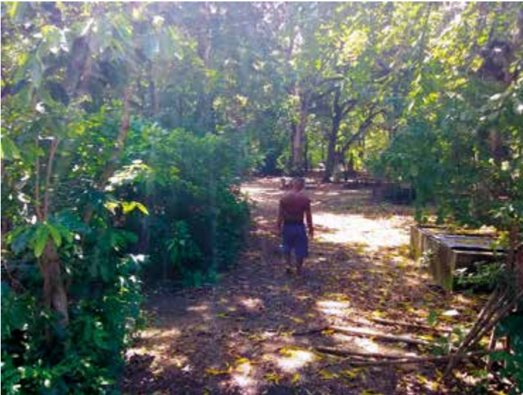
Figura 3. Árboles de mango en el patio de Librada.

Nos encontramos y habitamos mundos entrelazados. Aunque con este ejemplo Donna Haraway está señalando las opresiones que comparten entre especies (ella y su perra) asociadas a la raza, se puede asociar a las múltiples formas en que existen la casa de Librada como hábitat-multiespecie. ¿Cómo organizamos y entendemos la casa? Limoncillos, matas, totumos, patos, humanas, trabajadoras, negras. Humanos y no-humanos vivimos las consecuencias en nuestras carnes.