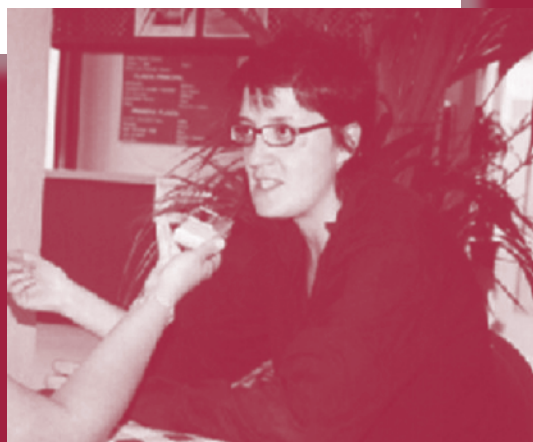
Paul B. Preciado durante la entrevista para OPsiones. UNIVERSIDAD DE LA LAGUNA, TENERIFE, ISLAS CANARIAS, ESPAÑA.

Paul B. Preciado (Burgos, España, 1970), es filósofo, comisario de arte y escritor, considerado uno de los pensadores contemporáneos más influyentes por su trabajo sobre las políticas del cuerpo, el género y la sexualidad. Colaboró en la emergencia de la teoría queer en Francia. Entre sus libros destacan Manifiesto contra-sexual (Anagrama, 2002); Testo yonqui (Espasa, 2008); Pornotopía. Arquitectura y sexualidad en «Playboy» durante la guerra fría (Anagrama, 2010), el cual fue finalista del Premio Anagrama de ensayo, y Un apartamento en Urano. Crónicas del cruce (Anagrama, 2019). En 2018, la revista Art Review lo colocó en el lugar 23 dentro de la lista internacional de las cien personas más influyentes y poderosas del mundo del arte.