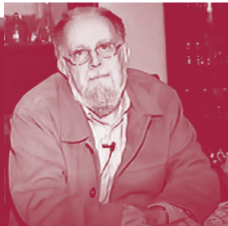
Hugo Gutiérrez Vega al finalizar la entrevista. CASA DE LA FAMILIA RUIZ POSADA, SANTIAGO DE QUERÉTARO, QRO.