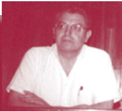
Manuel Camacho durante la conferencia que brindó en la UAQ.

Manuel Camacho Solís (Ciudad de México, 1946-2015) fue un político que se desempeñó en importantes cargos públicos. Fue regente del Departamento del Distrito Federal, secretario de Relaciones Exteriores, negociador de la paz en Chiapas y candidato presidencial por el Partido del Centro Democrático. En 2012 fue electo senador de la República.