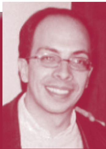
Jorge Volpi al término de la entrevista.

Jorge Volpi Escalante (Ciudad de México, 1968) es un escritor miembro de la Generación del crack , cuyos libros han sido traducidos a 30 idiomas. Ha impartido cátedra en las universidades de Emory, Las Américas de Puebla, Cornell, Católica de Chile y Princeton. Fue director del Instituto de México en París, Canal 22 y del Festival Internacional Cervantino. En 2018 ganó el Premio Alfaguara por Una novela criminal . Es coordinador de Difusión Cultural de la UNAM.