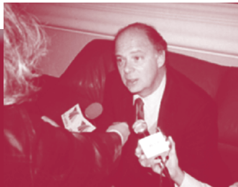
Enrique Krauze atendiendo a OPsiones. CLUB DE INDUSTRIALES DE QUERÉTARO.

Enrique Krauze Kleinbort (Ciudad de México, 1947) es historiador y escritor; dirige la revista Letras Libres . Ingresó en El Colegio Nacional en 2005. En 2008 el rey de España lo condecoró con la Gran Cruz de la Orden de Isabel la Católica. En 2010, el Gobierno de México lo distinguió con el Premio Nacional de Ciencias y Artes en la categoría de Historia, Ciencias Sociales y Filosofía. Ha escrito numerosos libros y ensayos.