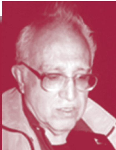
Carlos Monsiváis en la entrevista para el semanario. PATIO BARROCO DE LA FACULTAD DE FILOSOFÍA DE LA UAQ.

Carlos Monsiváis Aceves (Ciudad de México, 1938-2010) fue escritor, cronista y periodista ampliamente reconocido en México e Iberoamérica. Mercedor de múltiples galardones, entre los que destacan el Premio Nacional de Periodismo (1977), Premio Mazatlán de Literatura (1988), Premio Xavier Villaurrutia (1995) y el Premio Nacional de Ciencias y Artes en la rama de Literatura (2005).