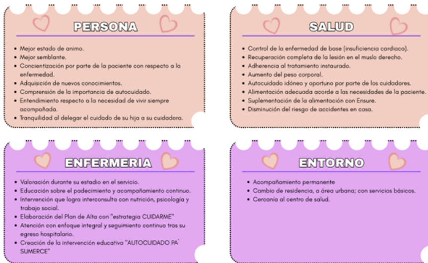
Gráfico 4. Resultados de la intervención educativa basados en el metaparadigma de enfermería

En la gráfica 4, se muestran los resultados obtenidos luego de la intervención de enfermería, desde el momento de la hospitalización hasta finalizar el acompañamiento, logros que fueron basados en el uso del metaparadigma de enfermería: